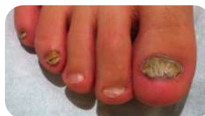
Exemples de lésions